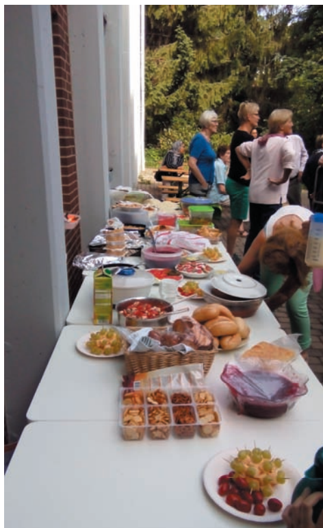
Das Büfett wird noch aufgebaut, lässt aber eine große Vielfalt erahnen.