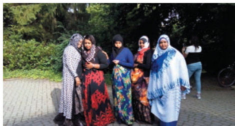
Somalische Frauen zeigen sich stolz in ihren farnefrohen Gewändern.

Die somalischen Frauen hatten sich extra für diesen Abend in ihre schönsten bunten Gewänder gekleidet, was einen leichten Hauch der unbekannteren Welt erahnen ließ.