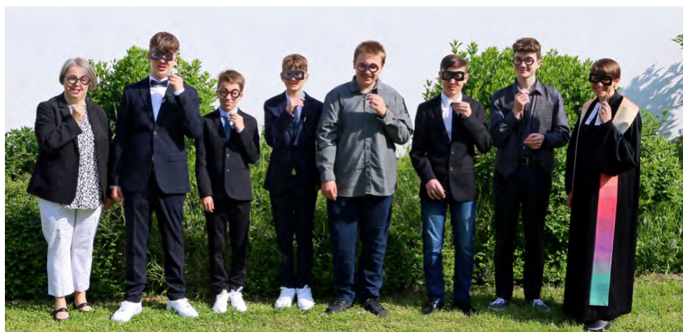
Die Konfirmanden vom 14. Mai 2023

Bei strahlendem Sonnenschein konnten am 30. April und 14. Mai in der Pauluskirche die Konfirmationen mit festlichen Gottesdiensten gefeiert werden. Im Konfirmandenunterricht hatten sich die Konfirmanden einen persönlichen Kelch getöpft, der bei der Abendmahlsfeier zum Einsatz kam. Jede/r Konfirmande hatte so ein ganz persönliches intensives Gefühl bei der Abendmahlsfeier. Nach dem Gottesdienst konnten sie die Kelche als Erinnerung an diesen festlichen Tag mit nach Hause nehmen