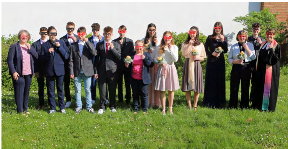
Die Konfirmanden vom 30. April 2023