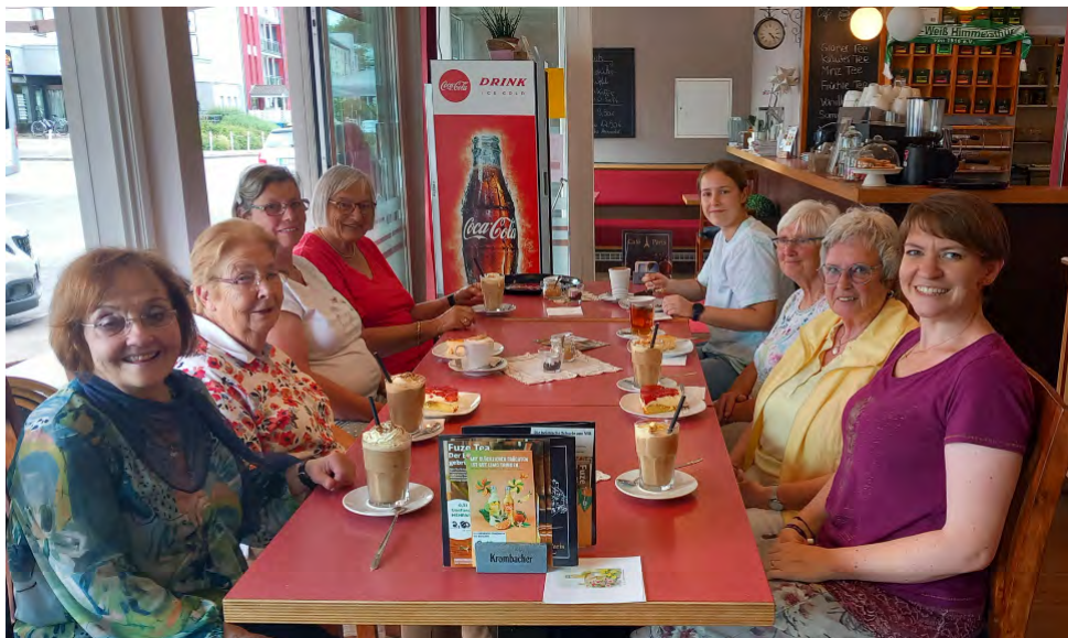
Der Besuchsdienst bei einer erfrischenden Kaffeerunde